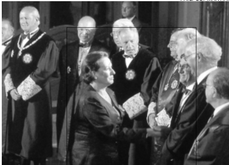
Apertura del año judicial, 1999.