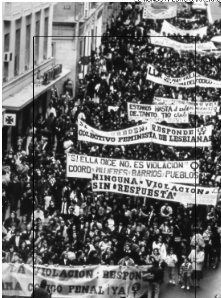
Madrid, 1989. Las mujeres exigen la modificación del Código Penal.