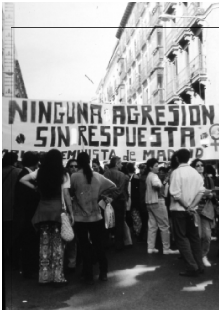
Madrid. Manifestación 8 de marzo de 1998.