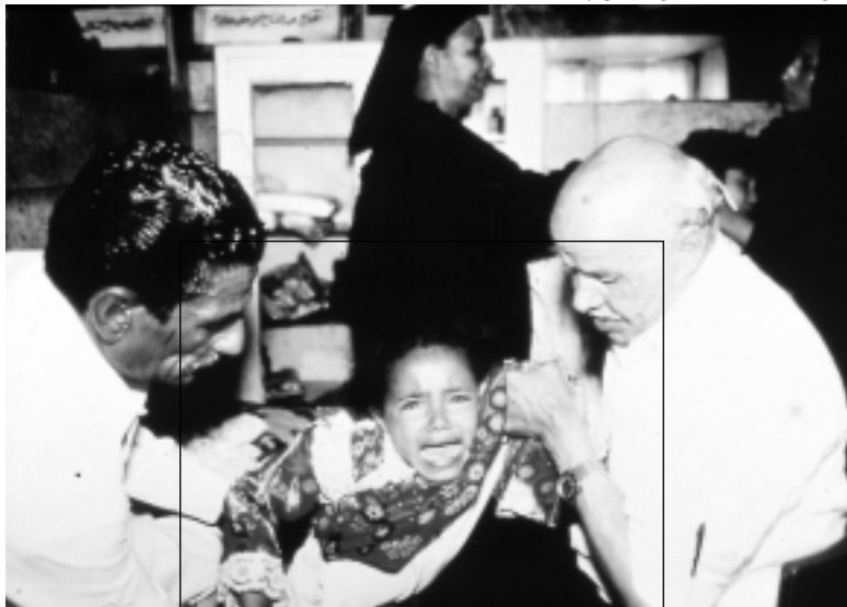
Mutilación Genital en Egipto.