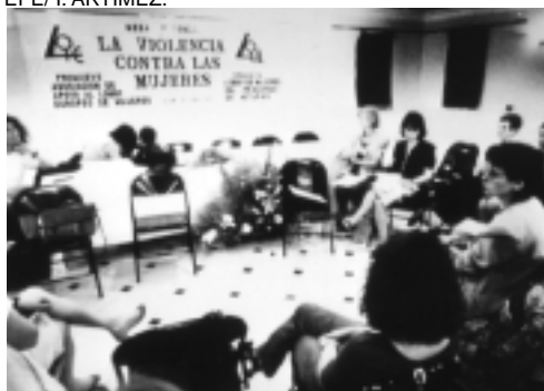
1/V/95, Gijón. Clausura de las jornadas sobre violencia contra las mujeres. Se eleva la petición de que el Premio Príncipe de Asturias se conceda a las mujeres argelinas que sufren la violencia integrista.