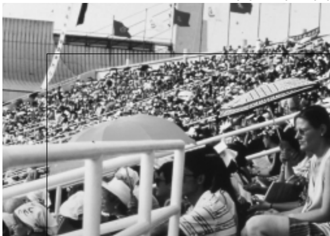
Pekín 1995. Apertura de la Conferencia Internacional de Mujeres, Foro ONGs.