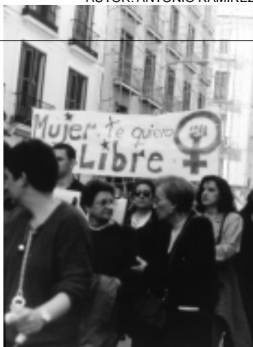
Madrid, 1998. Manifestación 8 de marzo.